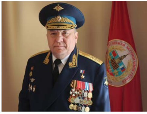
О РАБОТЕ РОССИЙСКОЙ АССОЦИАЦИИ ГЕРОЕВ