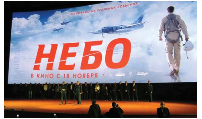
«НЕБО» ДЛЯ РОССИИ УЖЕ В ПРОКАТЕ