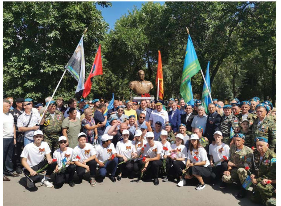
Ветераны ВДВ Самары на открытии памятника В.Ф. Маргелову