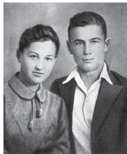
Зоя и Александр Космодемьянские

ставе 350 человек капитулировать. Было захвачено 9 танков, 200 автомашин и склад с горючим. За этот подвиг старший лейтенант Космодемьянский был представлен к званию Героя Советского Союза. Это звание ему было присвоено посмертно. 13 апреля 19-летний Александр погиб в бою.