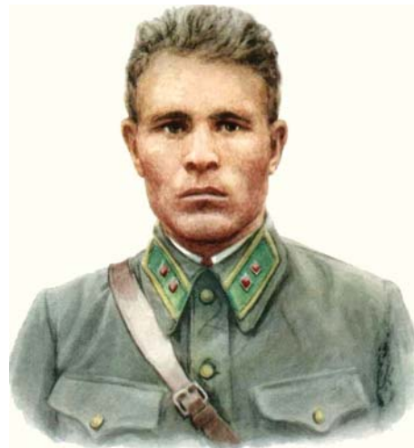
А.В. Лопатин, Герой Советского Союза

23 мая 1994 года Президент Российской Федерации Указом № 1011 предписал: «Установить праздник – День пограничника и отмечать его 28 мая». В этот день в 1918 году был принят декрет об учреждении пограничной охраны Советской России.